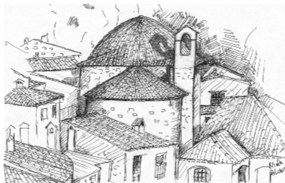
Chapelle des Pénitents Noir de Saint Sébastien à Peille

Au XVIII ème siècle le village comptait deux confréries, les Noirs et les Blancs. Les pénitents noirs ont occupés deux oratoires différents.