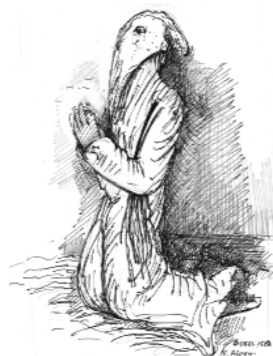
D'après un dessin de BUREL - 1584 (sous son bras, nous apercevons sa discipline)

Elle représentait aussi pour le pénitent une marque de fraternité puisque pouvait se côtoyer, sous le même habit et le nom de frère, un gouverneur de Provence et un ouvrier illettré.