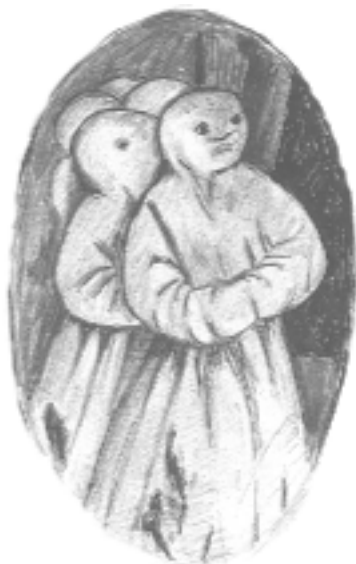
Détail du retable de la Piéta à la Cathédrale Saint Michel à Sospel où figure la plus ancienne représentation des pénitents du Comté.

Ces actes de dévotions prennent la forme de tableaux, de retables souvent riches et monumentaux. Ils sont le témoignage des moyens financiers dont la confrérie dispose. Dans certains tableaux apparaissent les pénitents en cagoule, nous renseignant ainsi sur les variations de détail du costume de chaque confrérie.