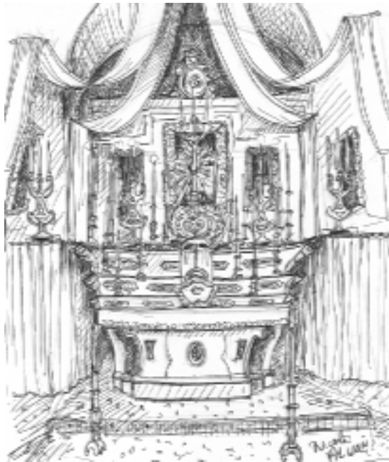
Intérieur de la chapelle des Pénitents Noirs de la Miséricorde à Tende (drapés d'apparat rouges et ors)

• La chapelle de la Miséricorde de la confrérie des Pénitents Noirs présente une façade austère qui contraste avec la décoration très chargée de l'intérieur.